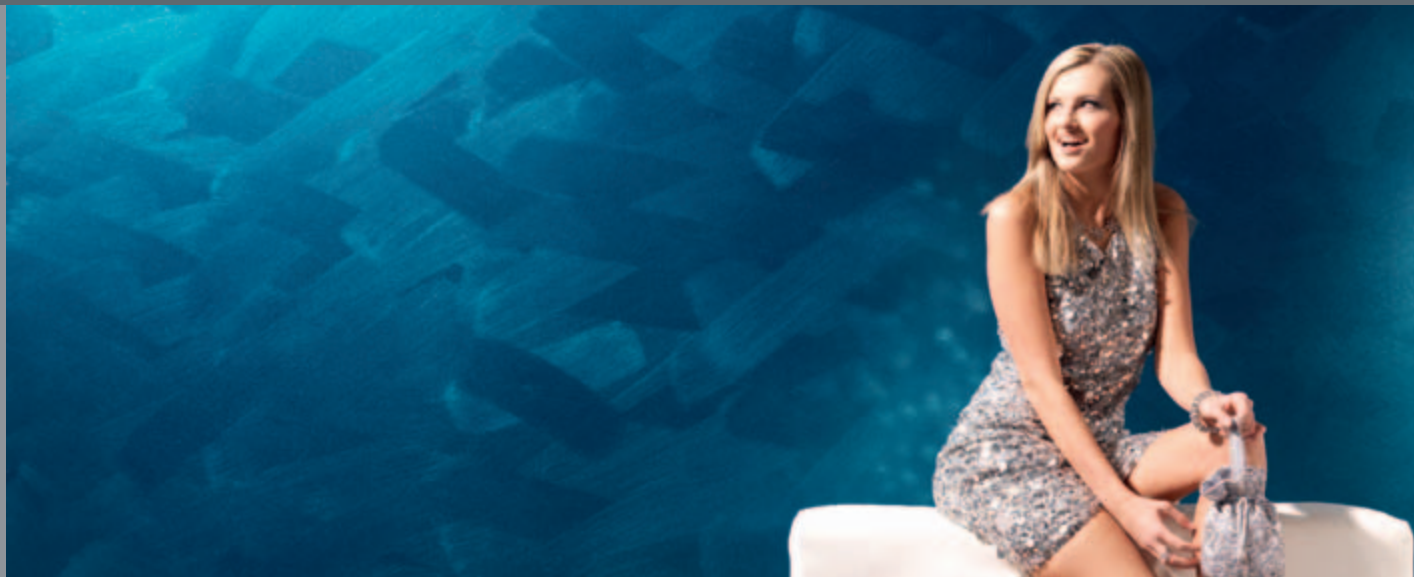
Wandfläche: 1x Amphibolin 3D Pacific 155 MET im Kreuzschlag gebürstet, 2x Metallocryl 3D Pacific 155 MET im Kreuzschlag gebürstet

Metallische Oberflächen für glänzende Perspektiven