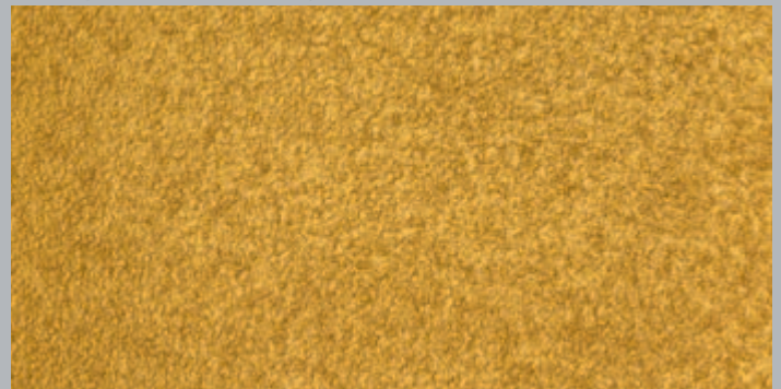
Gerollt: 2 mm Putz, 2x GoldGrund, 2x CapaGold

Weitere Informationen können Sie den Technischen Informationen Nr. 814 und Nr. 815 entnehmen.